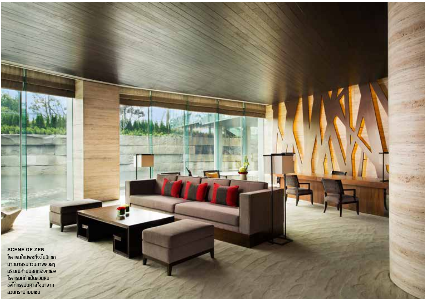
SCENE OF ZEN โรงแรมใหม่พอที่จะไม่บีบแถม มากมายจนทาบภาพสวยๆ บริเวณด้านบนกระจกของ โรงแรมที่กำเป็นสวนหิน ซึ่งได้แรงบันดาลใจมาจาก สวนรายไบนเซน